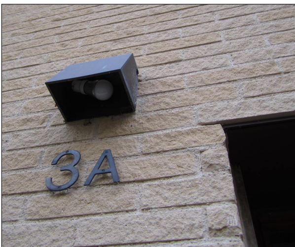
Bild efter installation