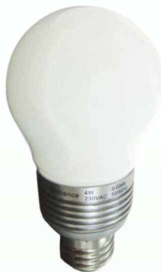
9005: 4W, E27