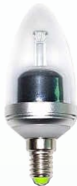
9007: 4W, E14

Lampans livslängd på 40 000 timmar motsvarar användning dygnet runt i fyra och ett halvt år.